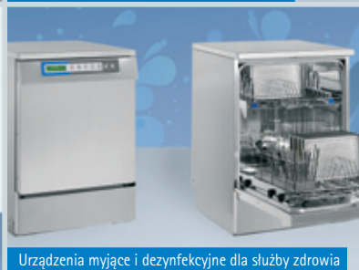
Urządzenia myjące i dezynfekcyjne dla służby zdrowia