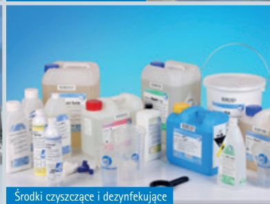
Środki czyszczące i dezynfekujące