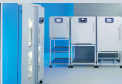
Suszarki i inkubatory laboratoryjne