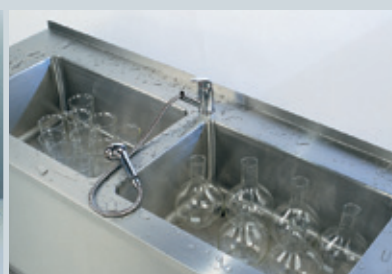
Nierdzewne części ruchome