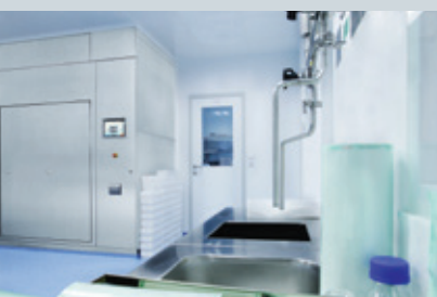
Szafy do deprotegenizacji VENTICELL® IL