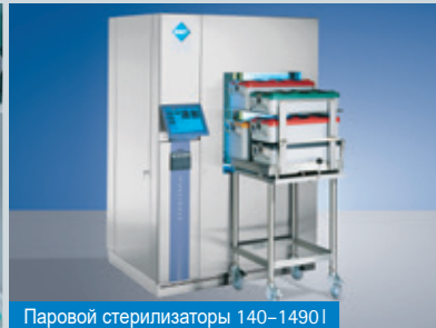
Паровой стерилизаторы 140–1490 л