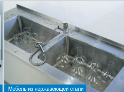
Мебель из нержавеющей стали