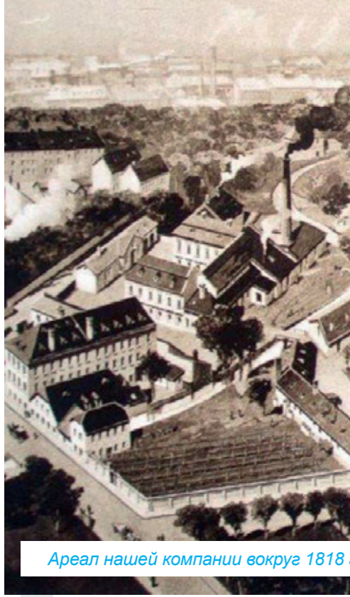
Ареал нашей компании вокруг 1818 г.

С 1992 г. является членом европейской группы MMM, которая с 1954 г. действует на мировом рынке как ведущий поставщик систем в сфере здравоохранения, науки и исследований. Компания MMM Group завоевала позицию передового носителя качества и инноваций на мировом рынке. Благодаря комплексному предложению продуктов и услуг,