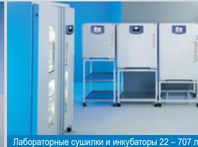
Лабораторные сушилки и инкубаторы 22 – 707 л