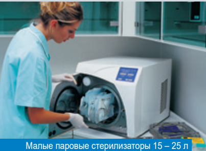
Малые паровые стерилизаторы 15 – 25 л