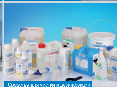
Средства для чистки и дезинфекции